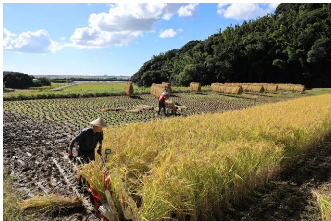
千葉県知事賞 「今年も豊作」