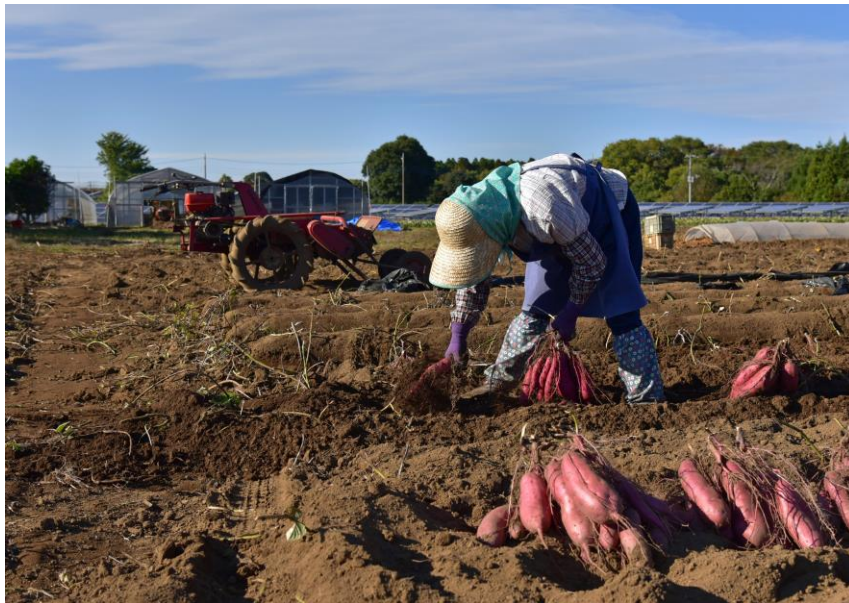
第29回「美しい農村環境写真コンテスト」 ちば水土里支援パートナー賞受賞作品「収穫」