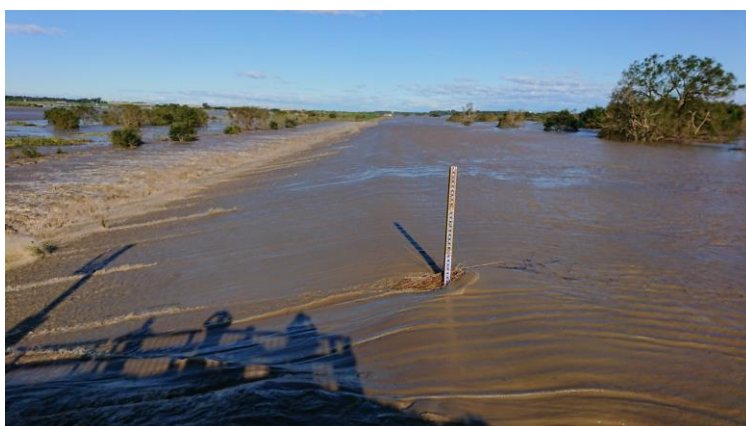
田中調節池への越流状況（令和2年10月 台風19号）

利根川流域調節池内耕作者の負担軽減のため、農林水産省及び千葉県に陳情を行いました。今後、国土交通省と災害復旧制度も含め、調整を図ってまいります。