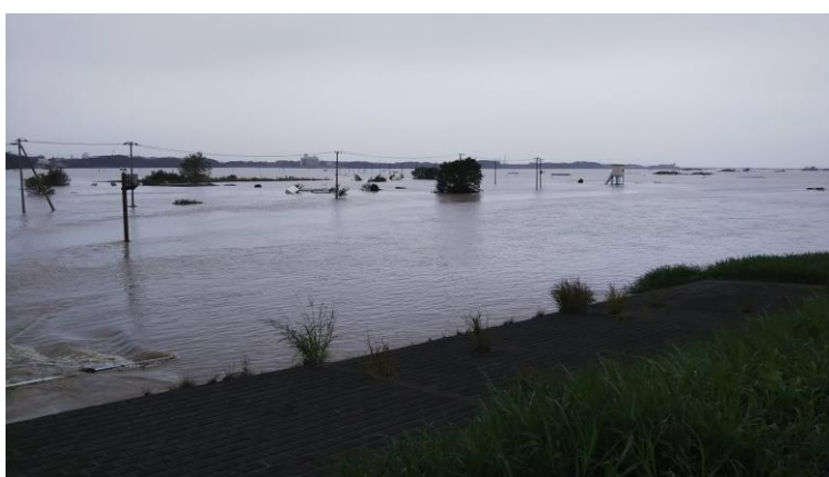
受益地水田（田中調節池）の湛水状況（ 同上 ）

利根川の河川災害が起きぬよう、調節機能の役割を有していることを農家組合員は十二分に理解しておりますが、一度調節機能を発揮すると、その災害復旧に多大な労力と費用が掛かることとなります。この問題を多少なりとも共有して頂ければ幸いです。