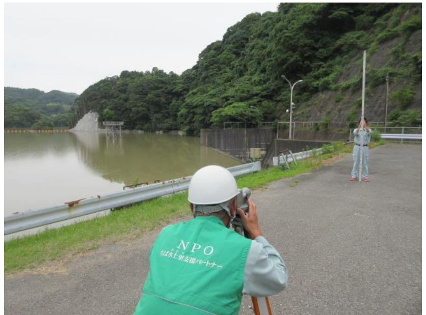
安房中央ダムの堤体観測状況