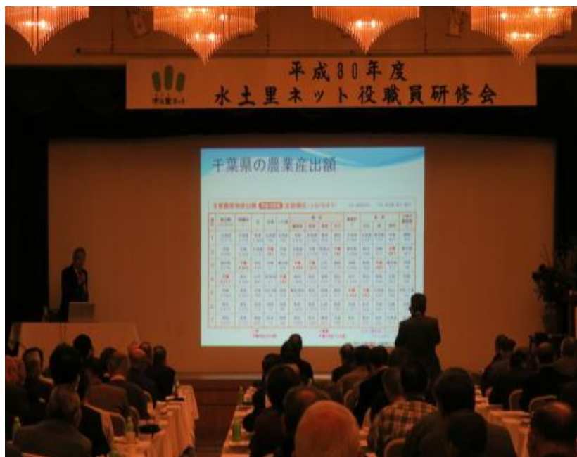
勝浦市ホテル三日月において

土地改良区の役職員に向けて本県の土地改良の変遷、改良区のあり方など改良区の経営基盤を強化するための研修会を実施